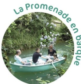
La Promenade en barque

Pour profiter autrement,... un peu plus longtemps,... de ces espaces magiques... (30 min de balade).