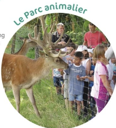
Le Parc animalier

Parcours pédagogique au long des parcs d'animaux aménagés entre la rivière et la forêt de chênes plus que centenaires, des sentiers fleuris,... et la possibilité de nourrir certains animaux, dont le Cerf.